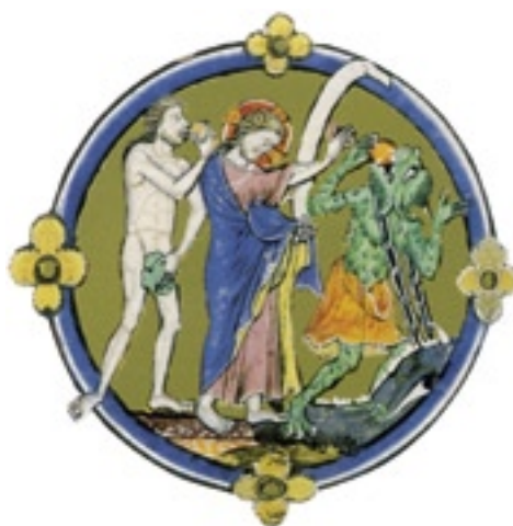
Detalls de la Bíblia de St. Lluís.