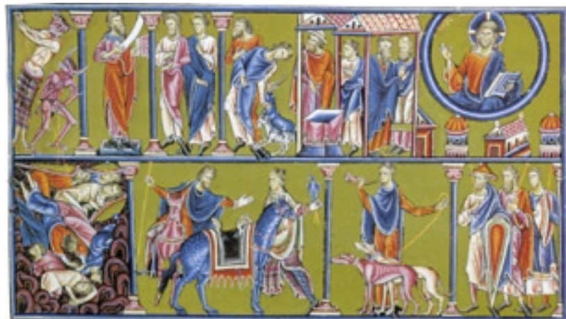
Llibre i detall, Saltiri triple anglo-català.