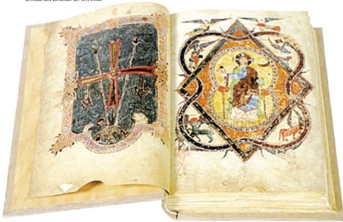
Beatus de Girona .

Ultra aquest Saltiri Triple Glossat anglo-català i el Llibre d'Hores de Maria de Navarra , tots dos amb clares connotacions catalanes, encara podem trobar-ne més en el preciosista catàleg de M. Moleiro Editor. Com l'altra obra mestra, l'anomenat Beatus de Lièbana, Còdex de Girona , considerat el manuscrit amb pintures més important i valuós de tot el segle X i l'únic Beatus les miniatures del qual són obra d'una dona, la miniaturista En, tot i l'ajut del presbíter Emeteri, En depintriix et Dei adiutreiix, frater emeteriix et presbiter , com consta al revers del foli 284