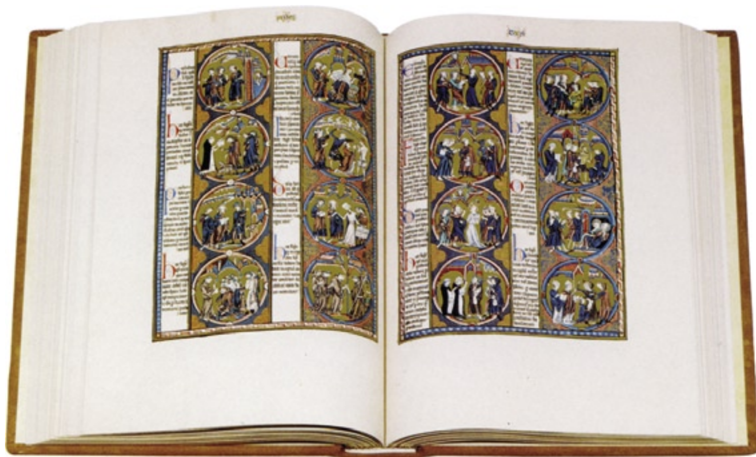
Biblia de St. Lluís.

molt gruixuts ja que les pàgines només es van poder escriure per una cara a causa del pes de l'or de cada un dels 4.887 medal·lons. L'edició de l'original va tardar deu anys i la còpia Moleiro sis anys. 14.000 euros és el preu del tres "quasi-originals" i els dos volums d'estudi d'aquest veritable monument artístic i bibliogràfic, realitzat entre 1226 i 1234 per a l'educació del sant rei Lluís IX de França per ordre de la seva mare, Blanca de Castella. Entre els personatges que disposen d'aquests facsímils hi ha el Papa Joan Pau II i el rei Joan Carles I. Tal vegada fent bona la dita d'Alfons X "el Savi" que considerà que l'original era una obra digna només de reis . Un atribut que és extensiu a la majoria de les obres "quasi-originals" de l'editorial Moleiro. Precisament a Toledo s'inaugurà, aquest desembre passat, l'exposició "Códices castellanos para emperadores y reyes" amb una trentena de rèpliques idèntiques dels meravellosos manuscrits ressuscitats per l'editor catalano-gallec. ✘