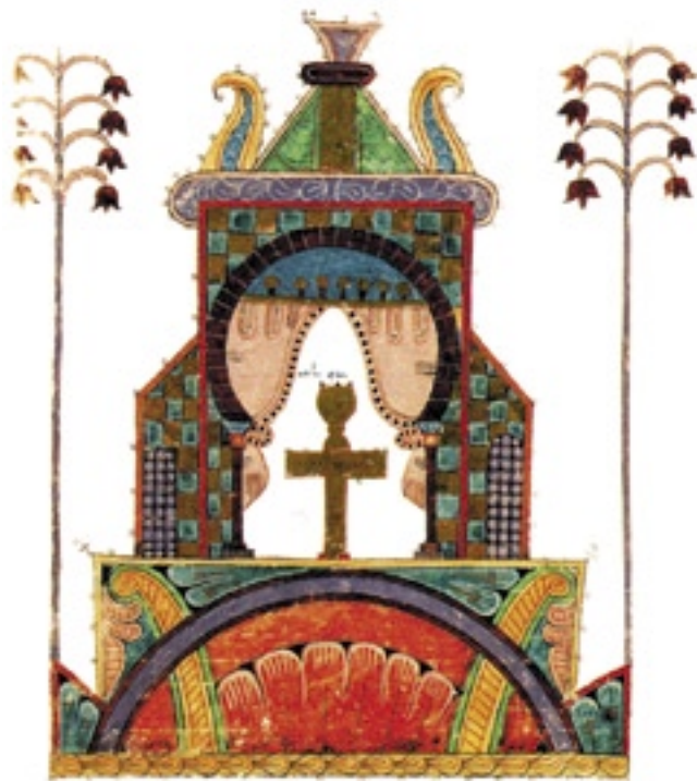
Detall del Beatus de Girona .

L'original del Saltiri està dipositat a la Bibliothèque Nationale de France, a París. La primera part, unes 184 pàgines, està fet a l'anglesa Canterbury i segueix el programa iconogràfic del Saltiri d'Utrecht , començant amb allò que Leroquais va qualificar com el pròleg del Saltiri , vuit extraordinàries miniatures a pàgina sencera, seguides de 52 superbes miniatures d'uns 15x32 mm a l'inici de cada salm. A partir de la pàgina 185 pren el relleu el taller català de Ferrer Bassa, amb 46 miniatures de l'ample de pàgina i de 15 a 25 cm d'altura, emmarcades en vius colors i dividides en dos o tres registres que es componen, al seu torn, de dos o tres compartiments. Del Saltiri , com de totes les edicions "quasi-originals" de Manuel Moleiro, se n'han fet només 987 exemplars, cada un garantit i certificat per acta notarial i que, passat un breu període promociónal, tindrà un cost d'uns 7.620 euros. Un preu que amb els anys es pot arribar a quadruplicar, com és el cas del Martirologio de Usuardo , una edició "quasi-original" de Moleiro, ja exhaurida, l'original de la qual es troba casualment al Museu Diocesà de Girona, després d'un llarg periple des del seu lloc d'origen, Praga, per Àustria, Hongria,