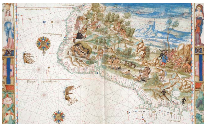
ATLAS VALLARD realizado en 1547 por un cartógrafo francés, contén 15 cartas náuticas ricamente ilustradas