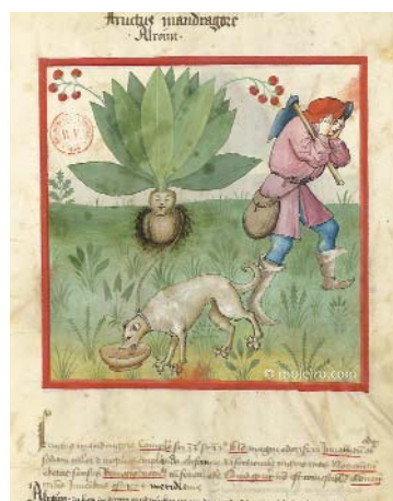
TACUINUM SANITATIS Un tratado de bienestar e saúde famoso no XIV e XV