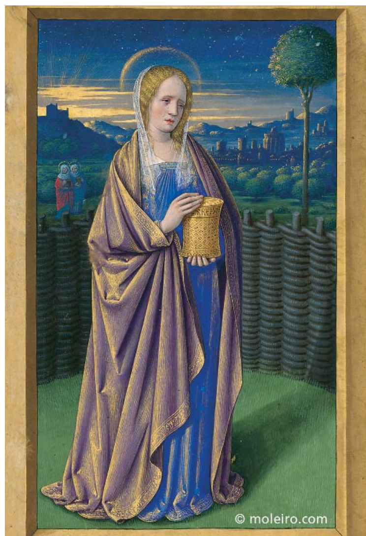
HORAS DE ANA DE BRETAÑA A obra mestra da pintura francesa destinada á raíña de Francia en dúas ocasións