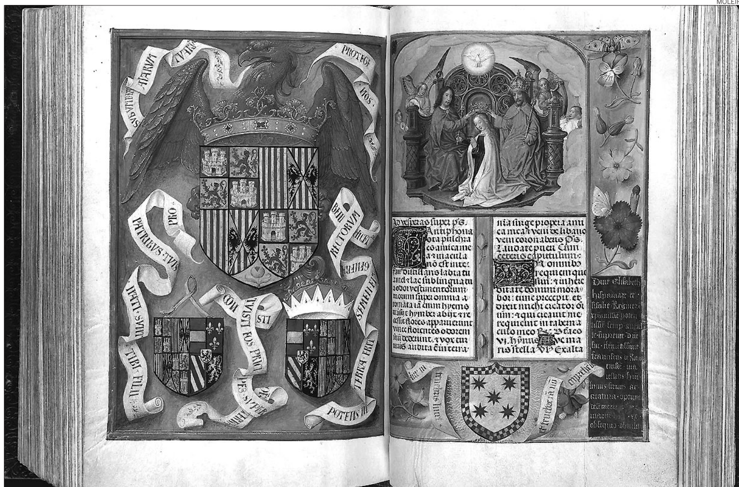
Imagen original de dos de las páginas del 'Breviario de Isabel la Católica', que conserva la British Library y que reproduce M. Moleiro

En fin, un códice de M. Moleiro Editor es apenas distinguible del original.