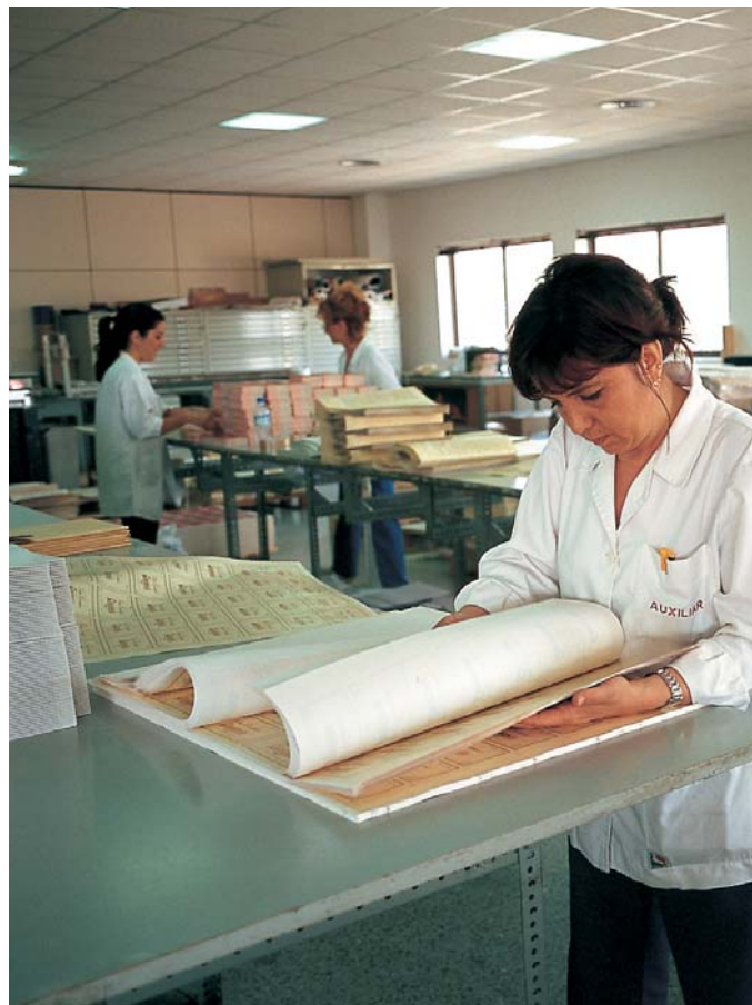
Tous les cahiers sont révisés avant la couture définitive, selon les méthodes traditionnelles de la relieur.

(30,5 x 20 cm), rédigé en latin, fut réalisé entre 1503 et 1508 et enluminé par Jean Bourdichon. Si le livre d'heures, recueil de prières, de textes et de psaumes, est le type le plus courant d'ouvrage médiéval enluminé, celui d'Anne de Bretagne est un véritable joyau, digne de celle qui fut « En France deux fois reine/Duchesse des Bretons/Royale et souveraine », épouse de Charles VIII en 1491, puis de Louis XII en 1499. Il comporte notamment quarante-neuf enluminures en pleine page, véritables compositions picturales d'un intérêt majeur pour l'histoire de l'art. Les trois cent trente-sept enluminures miniatures, en bordure des pages, sont également exceptionnelles. Elles offrent une représentation réaliste de centaines de plantes, désignées par leur nom en latin et en français, et font de ce livre de prière un véritable herbier où sont aussi figurés des insectes et de petits mammifères.