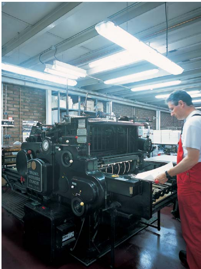
Dans les ateliers Moleiro, à Barcelone, on réalise l'estampage de l'or à chaud.