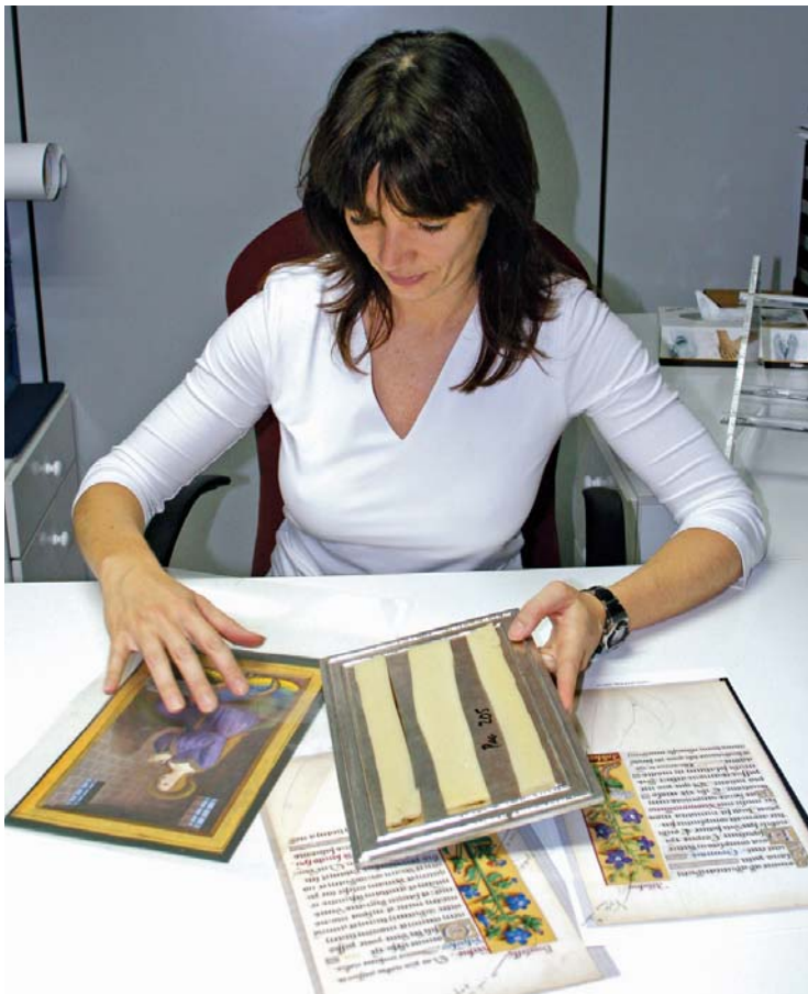
Chaque étape de la fabrication est précédée d'un contrôle minutieux des éléments, comme ici, les films et tampons avant l'estampage de l'or.