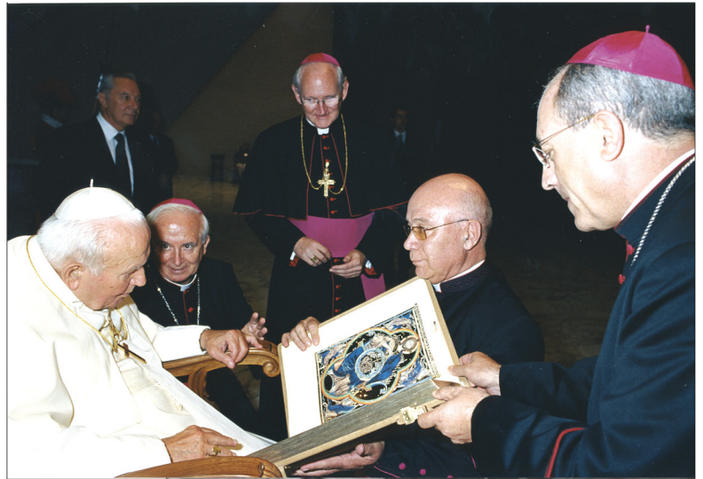
El Papa Juan Pablo II, recibiendo un ejemplar de la Biblia de San Luis, de la editorial Moleiro.

El interés cultural no es el único. Las réplicas de las joyas literarias que realiza el editor son contadas lo que supone —con el paso de los años— una revalorización de su precio. Un ejemplo, las dos primeras obras que copió se vendieron por 2.404 euros (400.000 pesetas). Ahora, totalmente agotadas cuestan 12.000 euros.