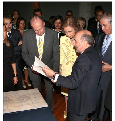
Los Príncipes con su Libro de Horas. Los Reyes, con la Carta de Población de A Coruña. // M.E.