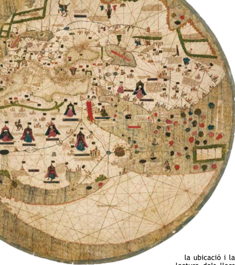
MAPA CIRCULAR CONSERVAT A L'ESCOLA CATALANO MALLORQUINA. MAPAMUNDI CATALÁN.

que se'ls indica per la seva càrrega simbòlica: per això, la representació de Jerusalem al centre, i la plasmació dels quatre rius del Paradís -Fison, Gihon, Tigris i Èufrates. De la mateixa manera que en tants altres mapes, en els dels Beats