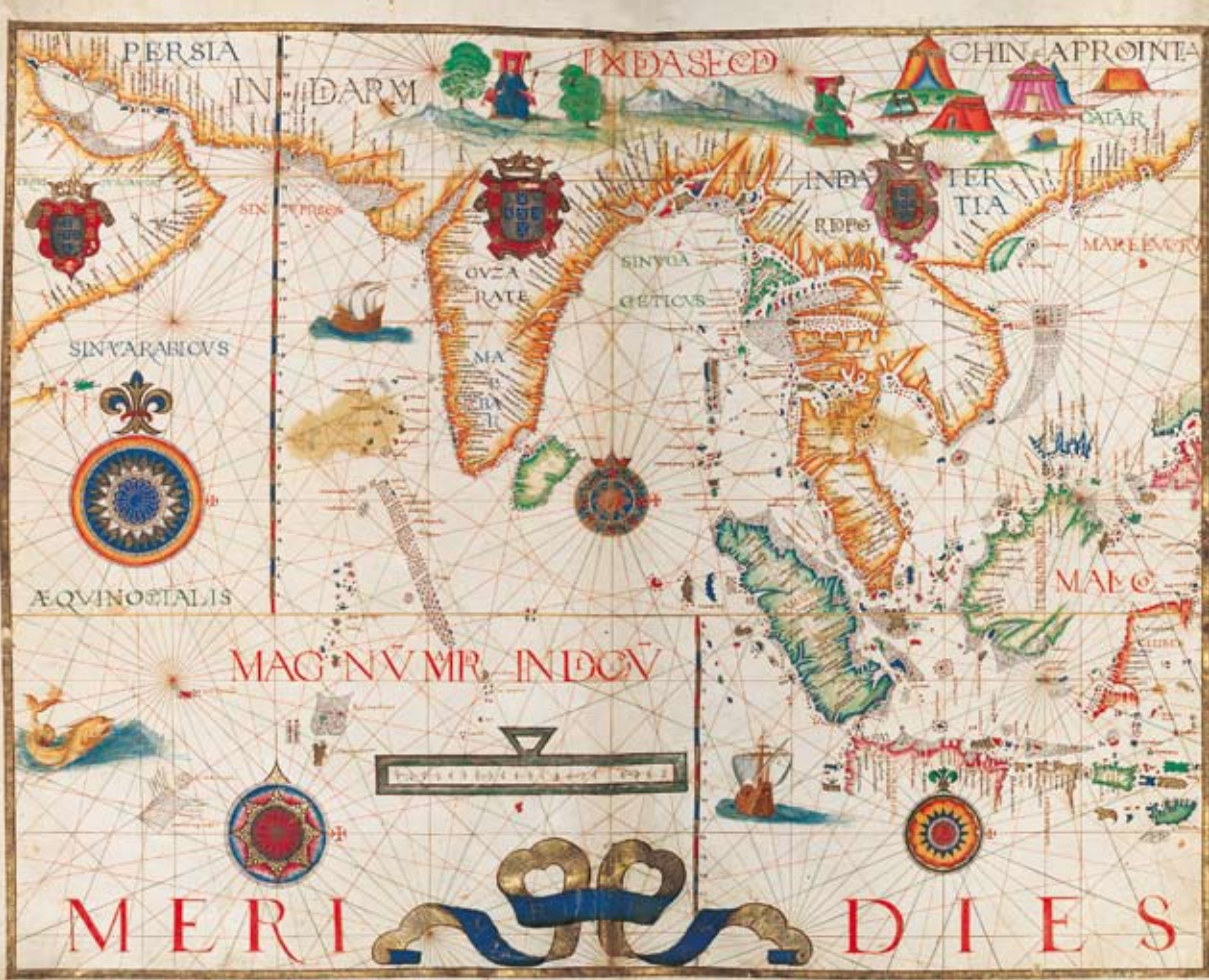
LITORAL DESDE EL GOLF PÈRSIC FINS L'EXTREM ORIENT. ATLAS UNIVERSAL: F9.

tres peluts). Però és que el relat sobre els pobladors d'aquelles terres llunyanes ja el trobem en l'Edat Mitjana, descrit en els "Mirabilia" o "meravelles del món" que en el fons eren literatura de viatges, però tenien també una vocació enciclopèdica, de sistematitzar els cada cop més amplis coneixements que l'home adquiria del món. S'hi recollien ja sabers geogràfics, etnològics, climàtics, etcètera, combinant fabuloses explicacions amb dades reals. Una de les obres més significatives d'aquest gènere fou el "Llibre de les meravelles del món", de Joan de Mandeville (segle XIV), a més de la con-