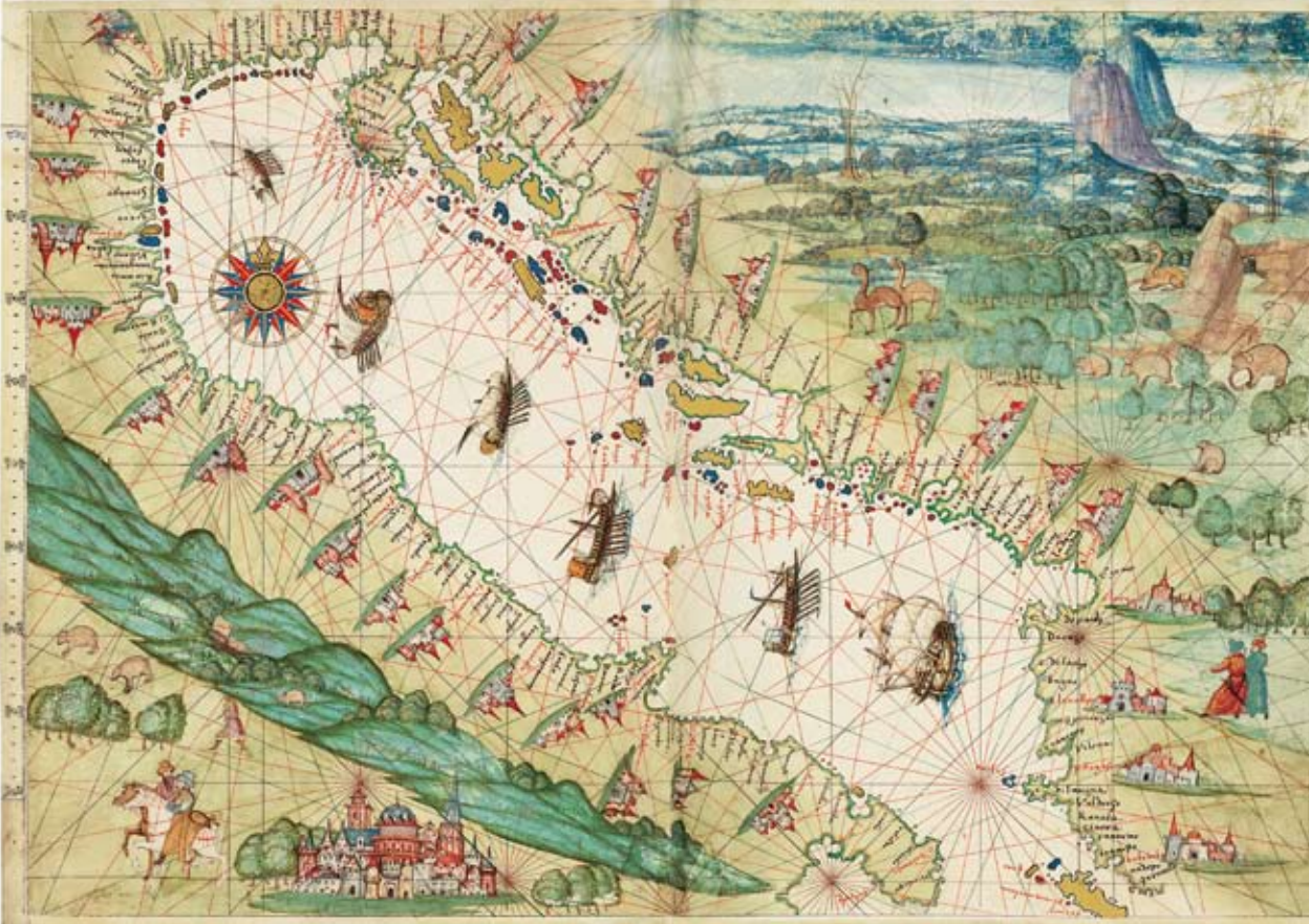
MAR ADRIÀTIC. ATLAS VALLARD.

l'àrea mediterrània durant el segle XIII, els mapes esdevenen més fiables, sobretot amb l'aparició dels portolans (documents en què únicament hi apareixen les ciutats costeres), que sens dubte van resultar eines imprescindibles pels navegants que acabarien "descobrint" el Nou Món. Un Nou Món que prendria el nom d'Amerigo Vespucci, cartògraf de l'escola de Sevilla, mort el 1512.