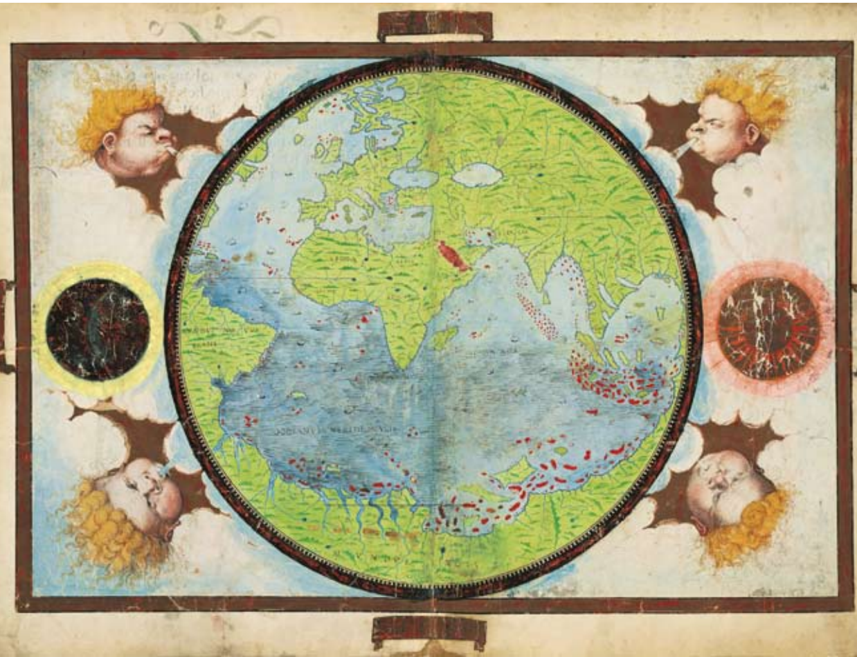
MAPA DEL SEGLE XVI ON PODEM VEURE EL 4 VENTS QUE ASSENYALEN LES 4 PARTS DEL MÓN. PLANISFERI. ATLAS MILLER.

ber clarament en quina part del món estan situats tots els llocs que llegireu en els llibres sants”, raó per la qual també recomana la lectura de la Cosmographia de Julius Honorius i de la Geographia de Ptolemeu.