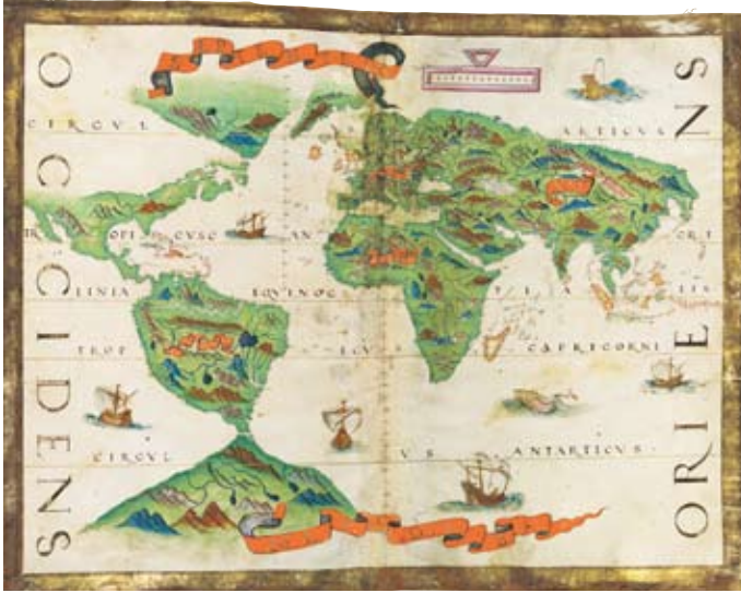
MAPA DEL MÓN. ATLES UNIVERSAL: F15. © M.MOLEIRO EDITOR. (WWW.MOLEIRO.COM)

delicioses obres literàries, artístiques i cartogràfiques. Els mapes -tal com avui els entenem- són encara, en aquesta època, representacions aproximades de la terra que inclouen sovint símbols religiosos i/o cosmològics.