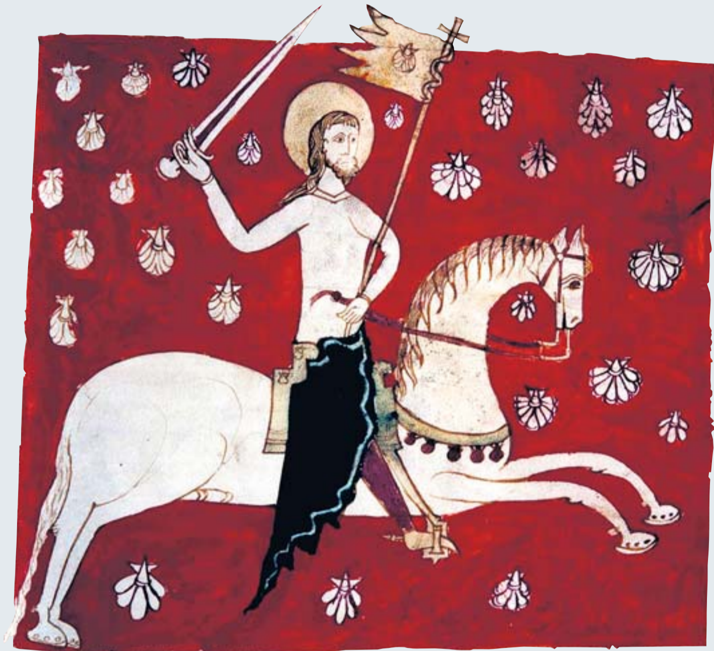
Detalle de una ilustración del Códice que representa a Santiago sobre un caballo blanco.