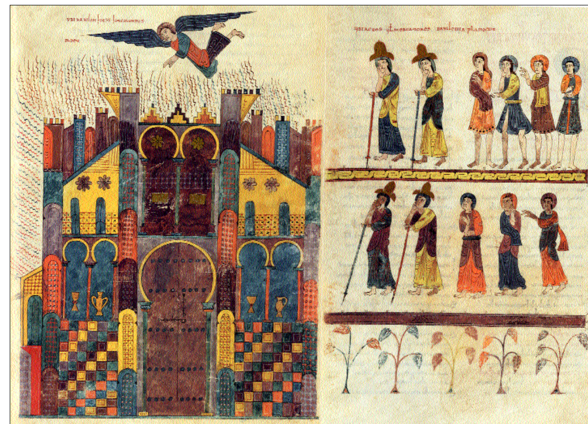
El fuego de Babilonia y el duelo de los reyes y de los mercaderes

cuidadas técnicas que han permitido que los colores sean iguales que los originales.