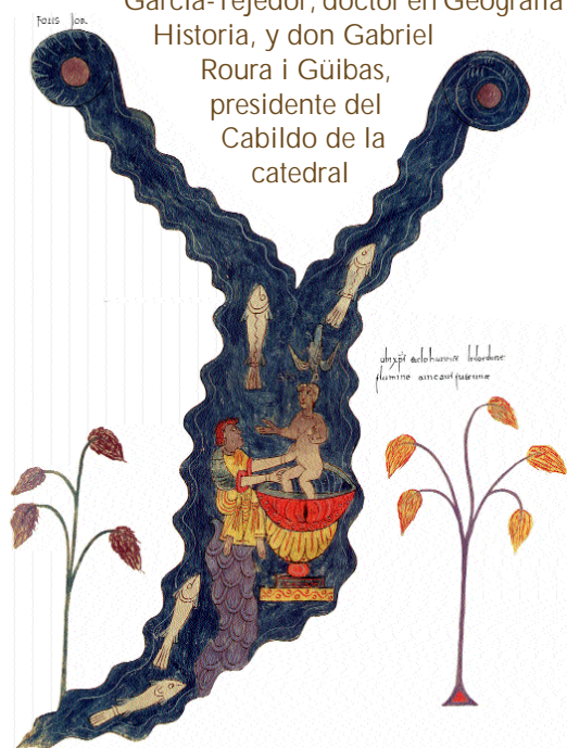
El bautismo de Cristo