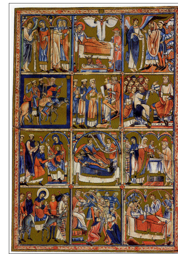
Salterio triple glosado