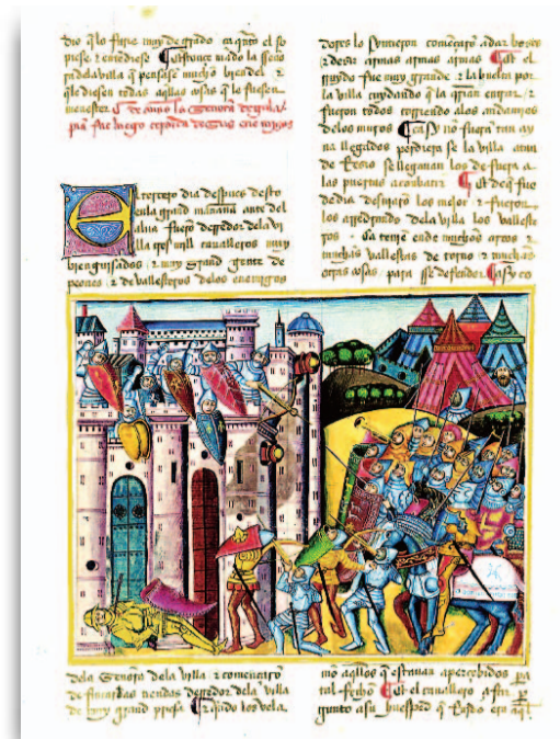
MEDIEVALES. 'El caballero de Zifar', el primer libro de caballerías.