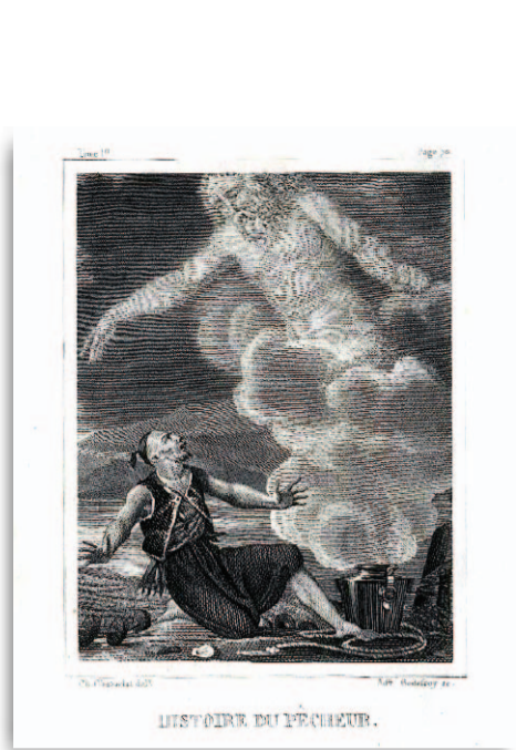
CUENTOS. 'Les mille et une nuits'. (J.A.S. Collin de Plancy).

él llama «casi original», disfruta de todo su contenido. «Hay ejemplares a partir de 1.500 euros». Y muchos temas donde elegir: 'El libro de la felicidad', encargado por el sultán Murad III (1546-1595) para su hija Fátima, contiene la descripción de los signos zodiacales, tablas astrológicas, astronómicas, un tratado de adivinación, y explica el carácter de las mujeres según sus ventajas físicas. 'El beato de Girona', del año 970, «el único pintado por una mujer», contiene una visión del Cielo, miniaturas de los evangelistas, y un detallado ciclo de la vida y muerte de Jesucristo poco común en el arte peninsular de la época. Moleiro bromea con 'El libro de los medicamentos', pintado para Francisco I de Francia. «Lleva la firma de Carlos V en un montón de páginas y está lleno de notas de sus médicos. No sé si Francisco I se lo regaló o él se lo confiscó alguna de las veces que lo tuvo preso».