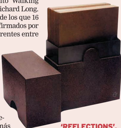
'REFLECTIONS'. De Eduardo Chillida. (Ed. Ivory Press).

Los materiales empleados son muy caros y requieren gran dedicación; y hay que recorrer medio mundo en busca de una seda, un papel o una piel de un color determinado. A veces, tras años de trabajo, el artista dice que el proyecto no le gusta y no sabe si quiere hacerlo. Y hay que empezar de nuevo. En cualquier caso, el precio no es algo disuasorio: los libros de Ivory Press se agotan antes de estar terminados.