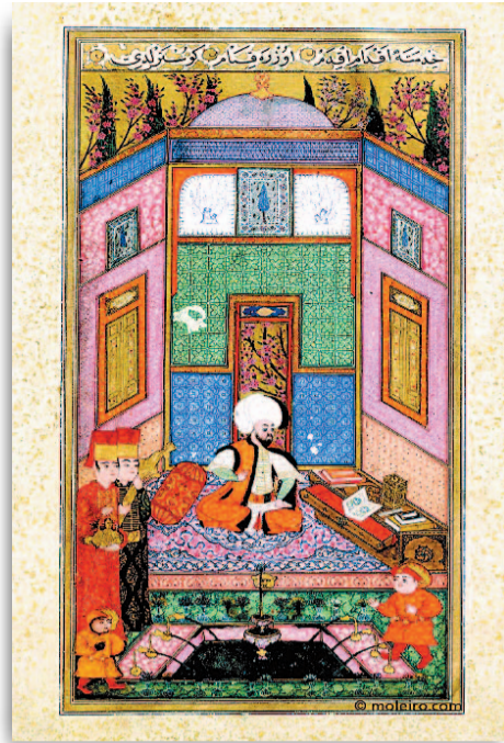
ORIENTALISTA. 'Libro de la felicidad'. (Ed. Moleiro).