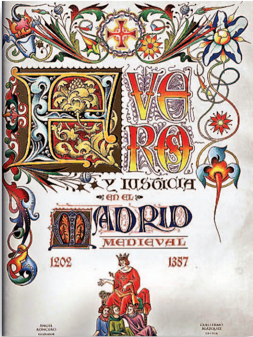
HISTÓRICO. 'Fueros y justicia en el Madrid medieval. 1202-1357'. (Ed. Torreblanca).