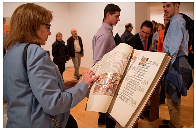
Una mujer observa con detalle uno de los códices expuestos.

Para esta ocasión y como primicia, Moleiro presenta su último trabajo, una de las obras de arte de la iluminación más bellas y más famosas de todos los tiempos, el "Libro de la Caza", dictado por Gaston